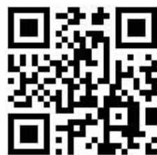
高雄住宅補貼 行動專區