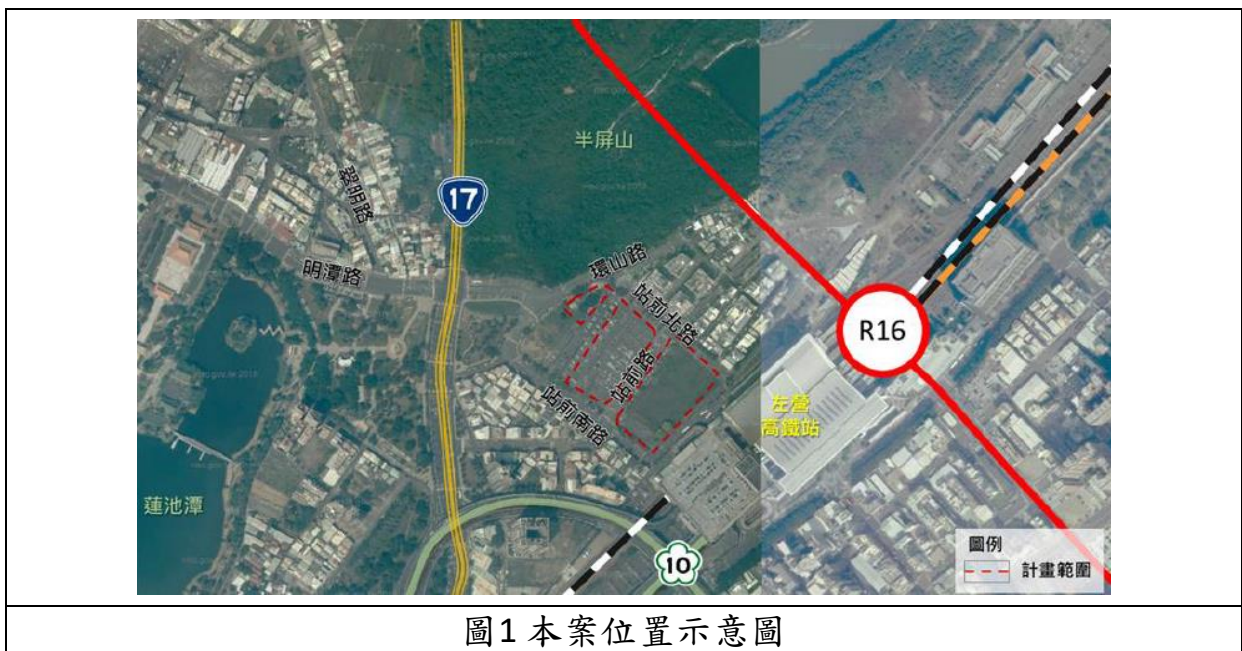
圖1 本案位置示意圖

計畫位置高雄市主要計畫中之凹子底細部計畫範圍內，位於高雄市左營區高速鐵路左營車站西側與半屏山間之區域，為促進土地有計畫之再開發利用，復甦周邊都市機能、改善居住環境與景觀，依都市更新條例第5條劃定更新地區，其範圍北臨站前北路，東接高鐵左營站，南臨站前南路，西接環山路，惟不含站前路及部分第四種商業區土地，總面積為2.5956 公頃，更新地區範圍如圖1。