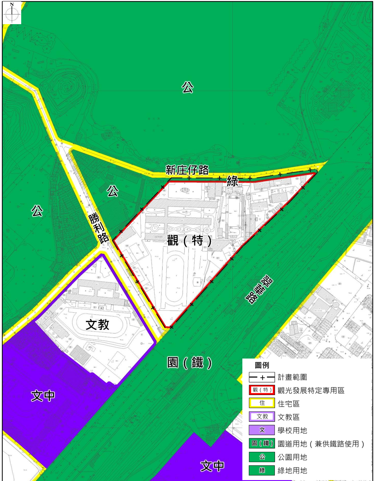
圖一 本計畫範圍示意圖

本計畫區位於翠華路、新庄仔路、勝利路間，行政轄區屬高雄市左營區。其計畫範圍包含觀光發展特定專用區（4.67公頃）及綠地用地（0.13公頃），總計面積約為4.80公頃。