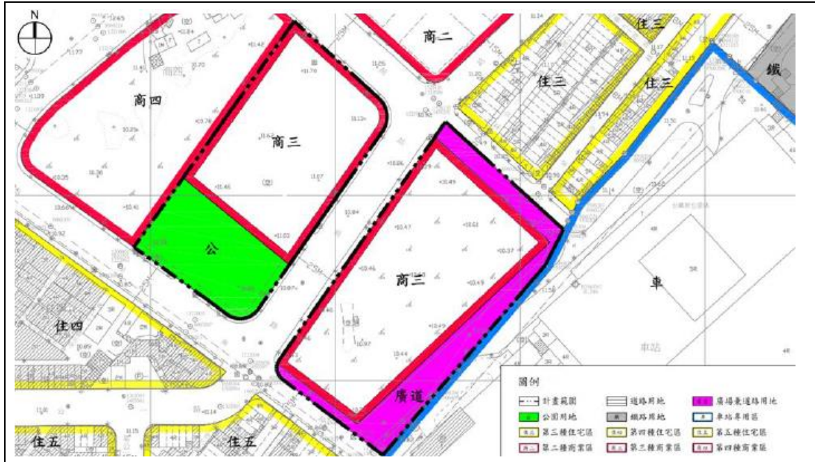
圖2 細部計畫土地使用示意圖

本案將現有廣場(兼停車場)用地與轉運專用區用地變更為第三種商業區、公園用地與廣場兼道路用地，如圖2。透過整體開發方式，將本計畫土地及國產署管有之國有土地(面積為2,002m 2 )納入整體開發範圍，合併後開發範圍面積合計25,956m 2 ，並透過都市更新方式辦理開發。如圖3。