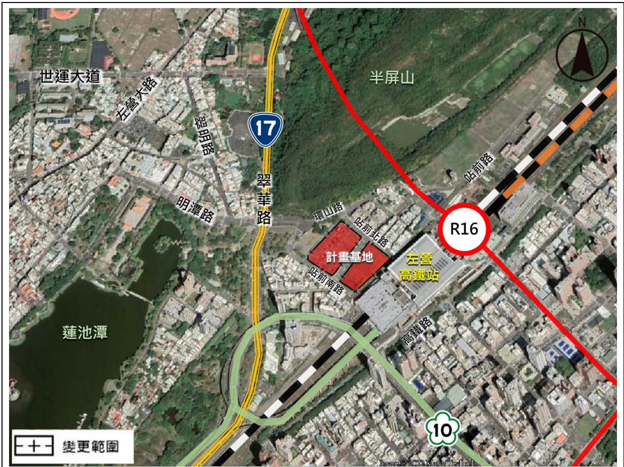
圖1 本案位置示意圖