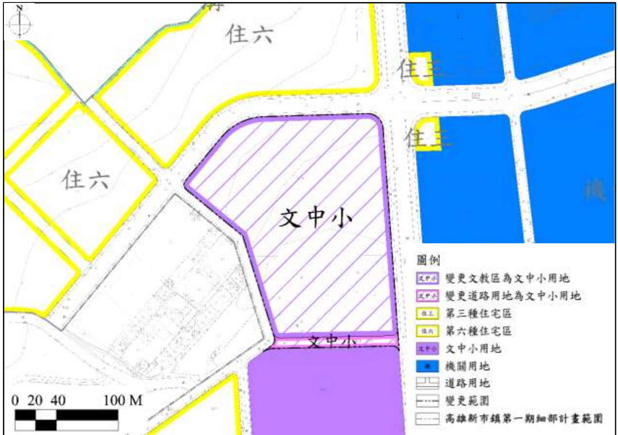
圖3 變更細部計畫第1案內容示意圖