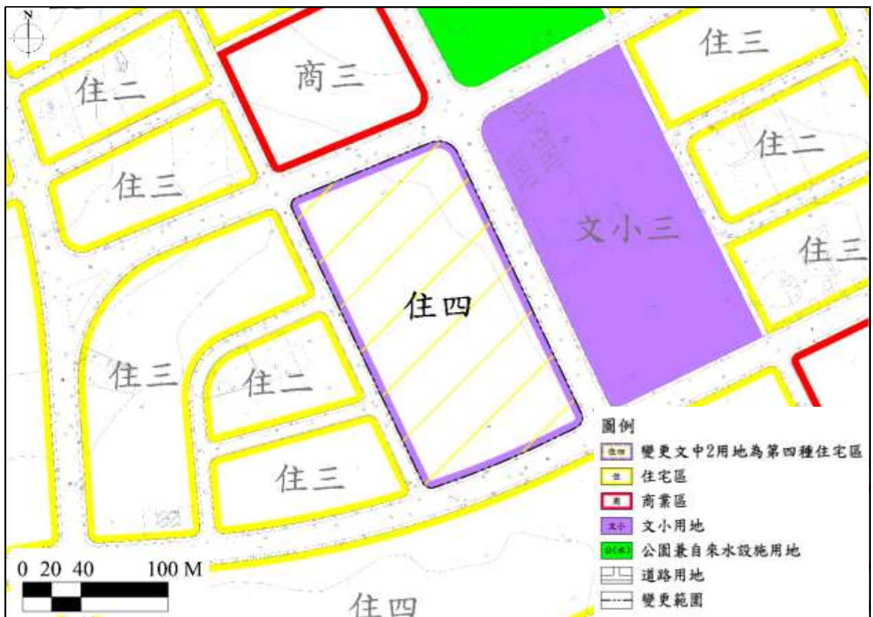
圖4 變更細部計畫第2案內容示意圖