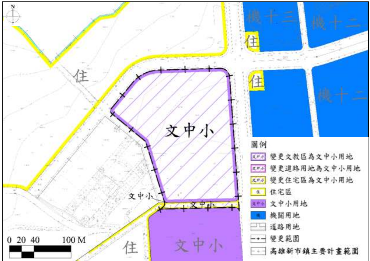
圖1 變更主要計畫第1案內容示意圖