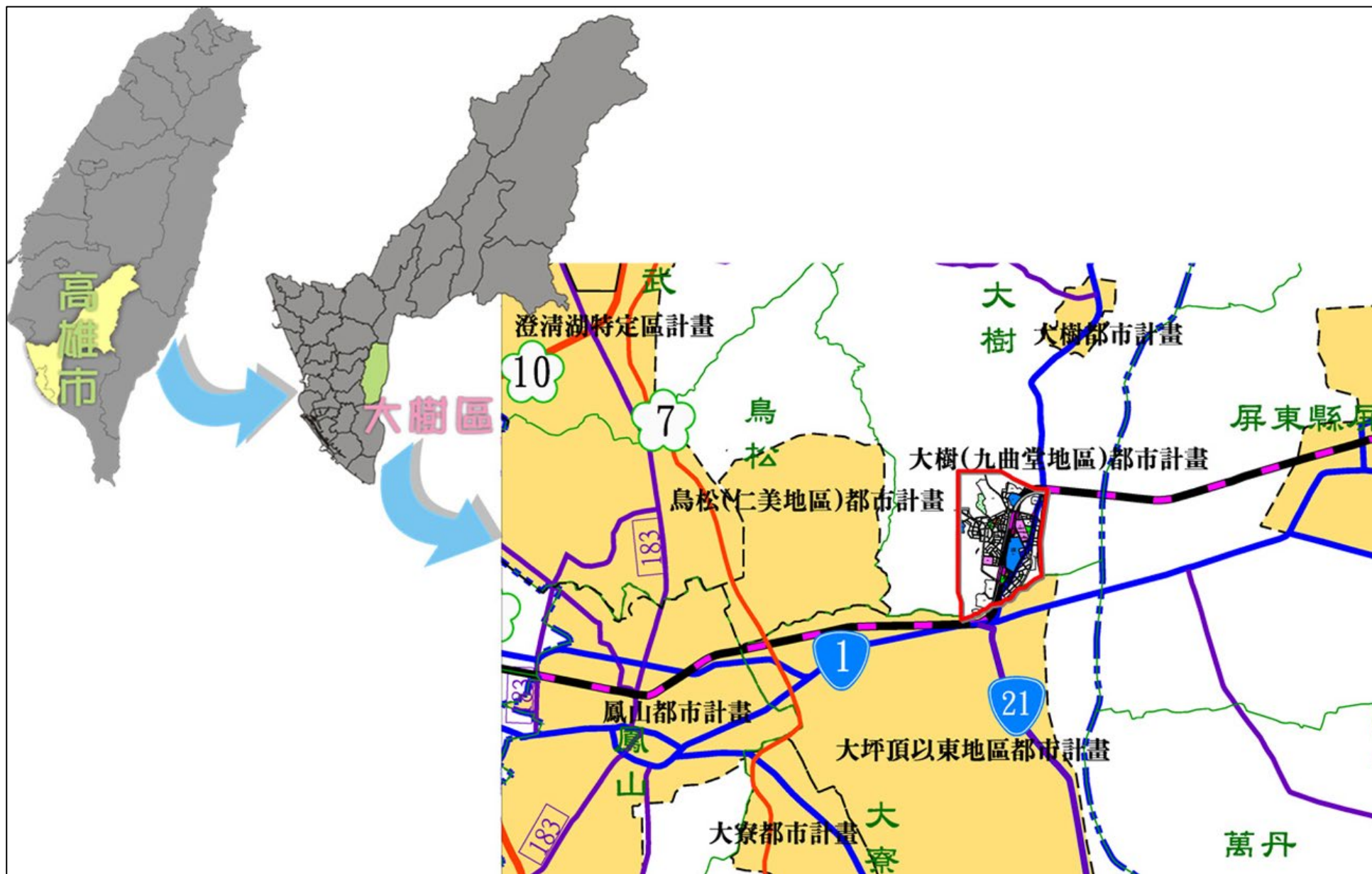
圖 1 地理位置及計畫範圍示意圖