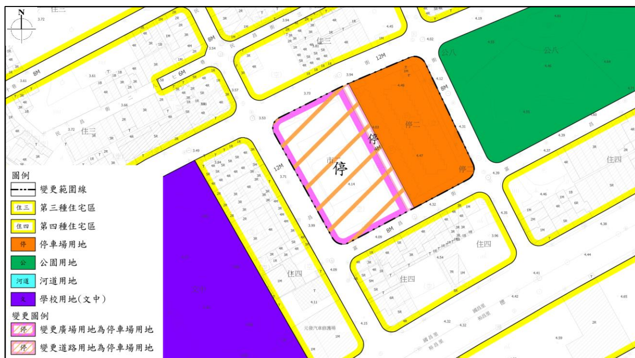
圖 1 都市計畫變更位置示意圖