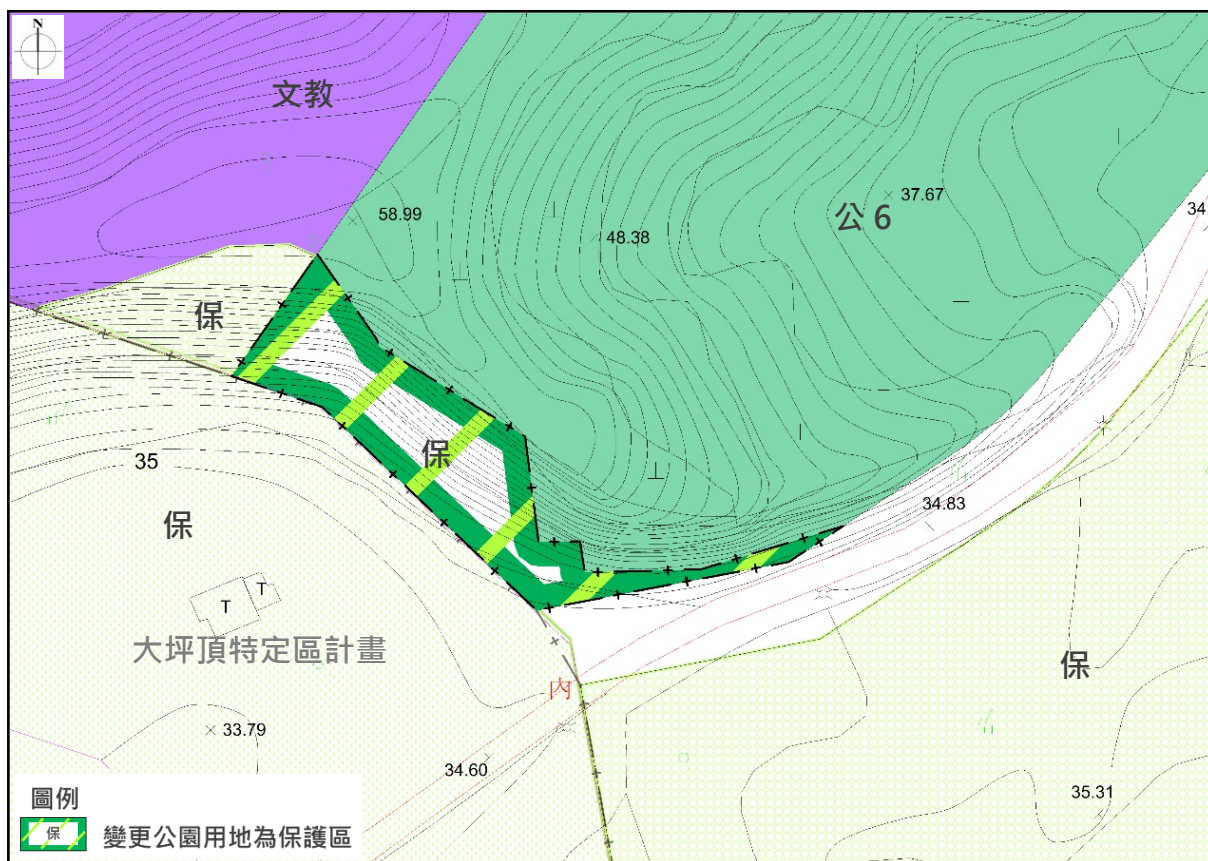
圖 4 變更編號 9 變更內容示意圖 (公 6 用地 (部分))