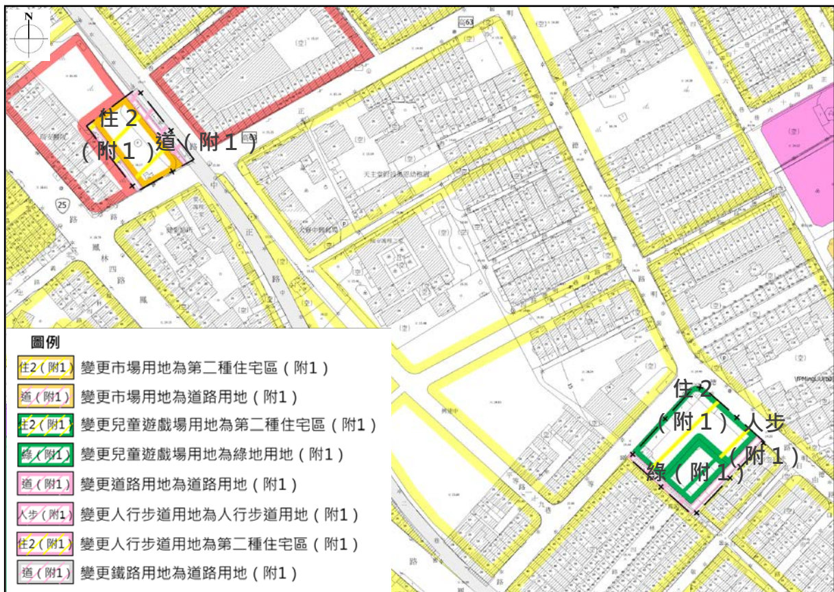
圖 2 變更編號 2 變更內容示意圖 (市 4、兒 8 用地)