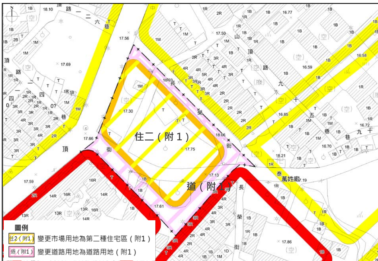
圖 3 變更編號 4 變更內容示意圖 (市 2 用地)