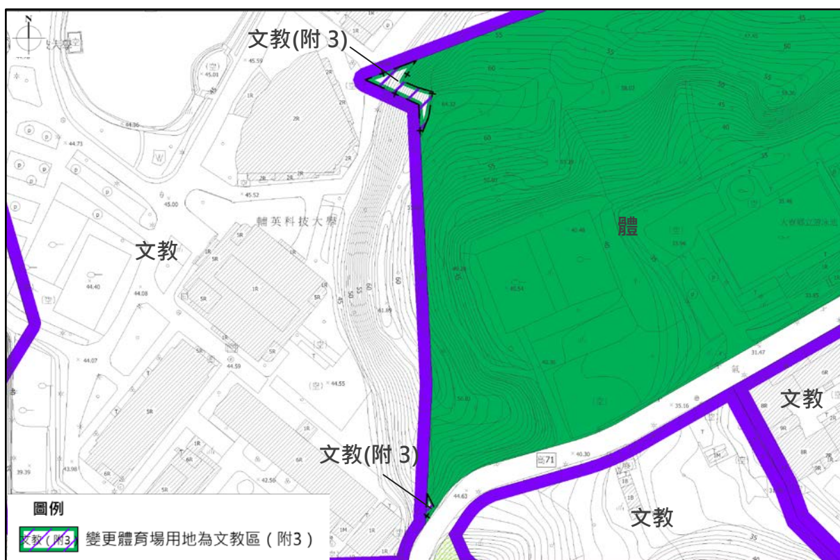
圖 5 變更編號 11 變更內容示意圖 (體育場用地 (部分))