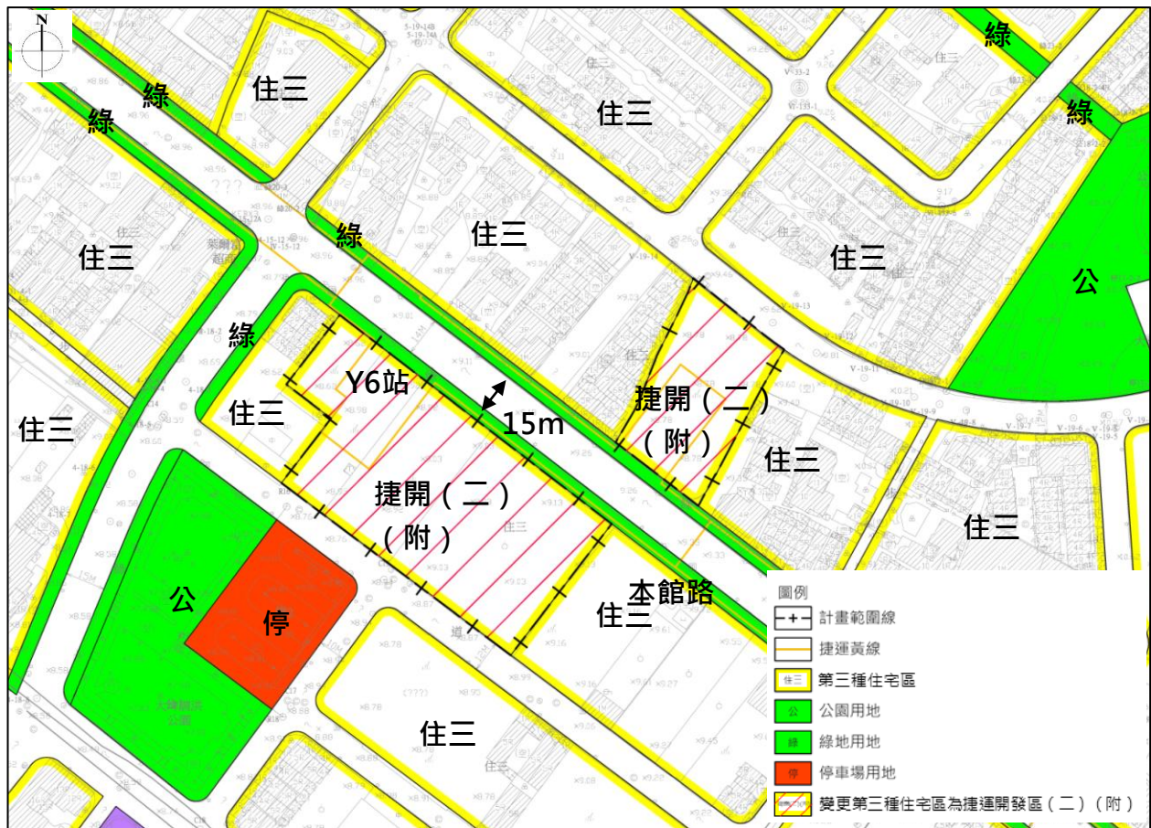
圖5 變更內容第5案 (Y6站) 示意圖