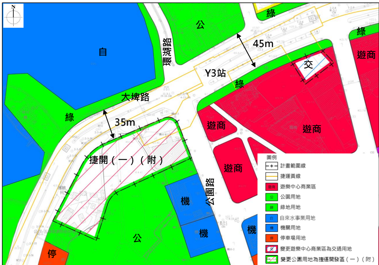
圖2 變更內容第2案 (Y3站) 示意圖