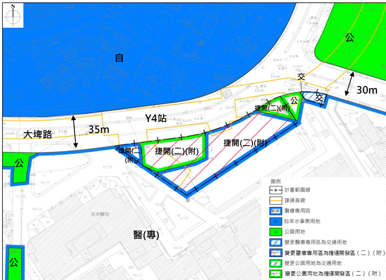
圖3 變更內容第3案 (Y4站) 示意圖