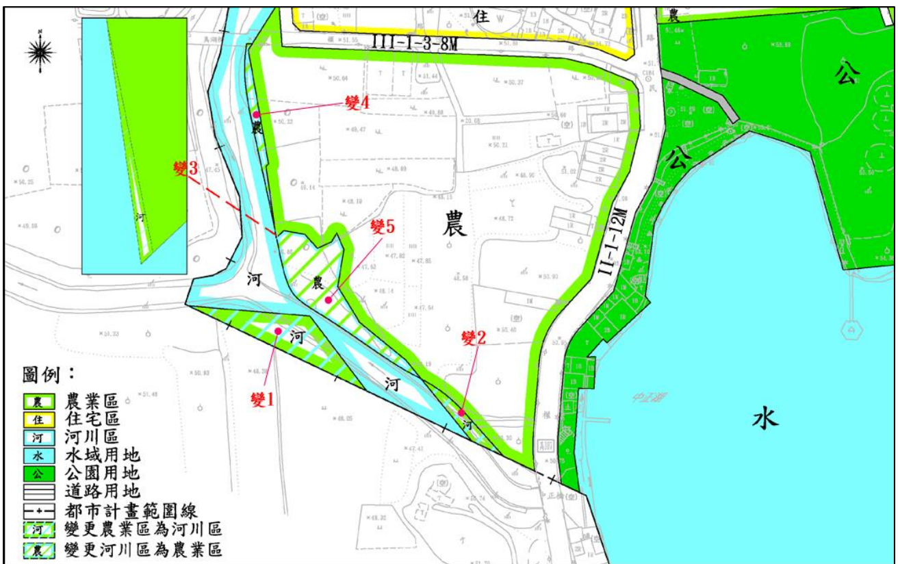
圖 2 變更內容示意圖