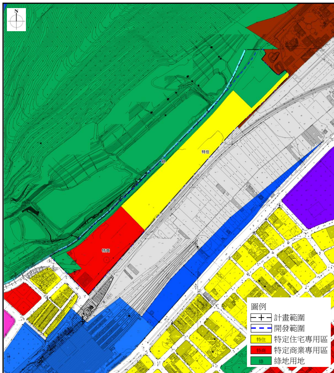
現行主要計畫示意圖

(但申請之基地規模不得少於6,000平方公尺)，若申請者未於上開各階段期限內完成則依程序檢討恢復原土地使用分區(不包含公共設施用地，且已完成所有權移轉登記之公共設施用地不予發還)。