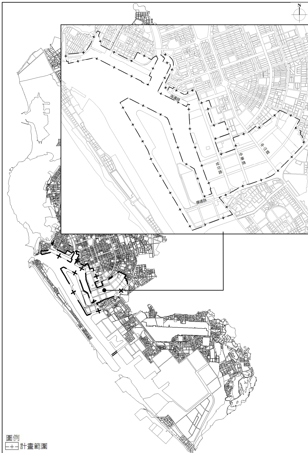
圖 1-4-1 計畫範圍示意圖