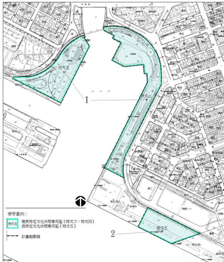
圖 5 變更計畫示意圖