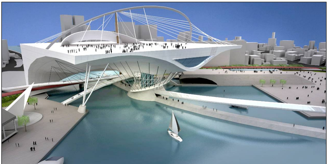
圖 3 海洋文化及流行音樂中心模擬願景圖

此外尚規劃流行音樂產業社群空間、音樂藝術與海洋科技文創產區、小型室內展演空間等，提供南台灣流行音樂界更國際化的音樂表演空間、搭配多元層面的人才培育課程，厚植流行音樂產業根基、並結合中山大學、海洋科技大學等海洋研究機構群，帶動海洋文化研究與教育推廣、發展周邊文化創意產業發展、塑造海洋音樂城市意象。海洋文化及流行音樂中心總經費 54.5 億元，將由中央編列資本門預算興建，計畫期程自民國 98 年 7 月至 104 年 10 月，預計 99 年完成基本設計，100 年開始施工作業，計畫於 104 年 4 月完工。