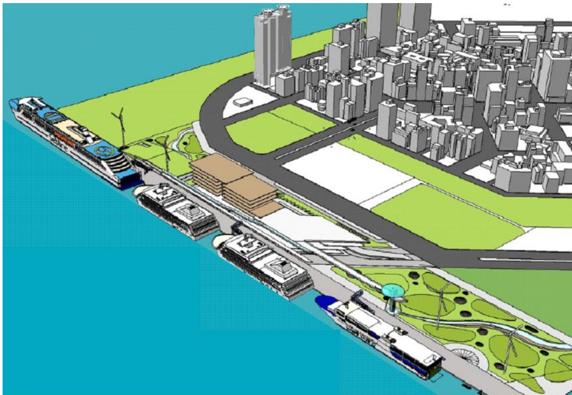
圖 4 高雄港港務大樓及國際旅運大樓空間規劃示意圖

高雄港舊港區 18~21 號碼頭全線長度 575 公尺，約可同時停靠兩艘大型國際郵輪及一艘國內線客輪，未來則將視客運市場之發展狀況，整合 16~17 號碼頭，全區作為客運碼頭使用。在船席安排方面，以 19、20 號碼頭為主要船席，供郵輪或快速渡輪通關使用，18 號碼頭為備用船席，作為過夜郵輪靠泊使用，另 21 號碼頭則作為國內線之固定船席使用。16 及 17 號碼頭可視船型長度彈性調配使用，並於未來納入客運碼頭之整體規劃。