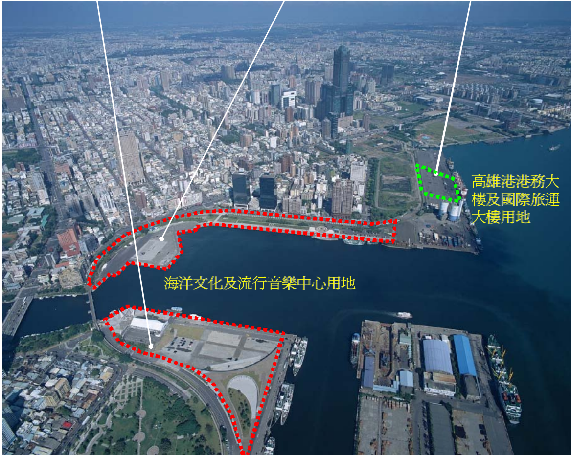
圖 2 基地暨週邊地區現況空拍圖